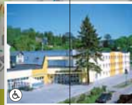
8. Sportovní centrum