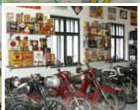
10. Muzeum techniky