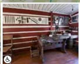
7. Pilníkářská dílna