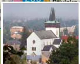
5. Kostel sv. Petra a Pavla