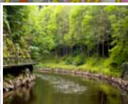
3. Riegrova stezka