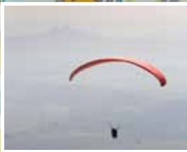
1. Paragliding na Kozákově