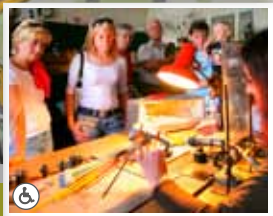
7. Sklářská dílna