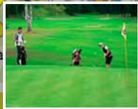
9. Golf Semily