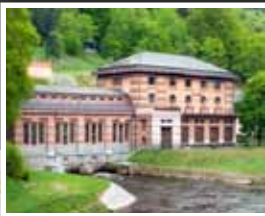
2. Vodní elektrárna