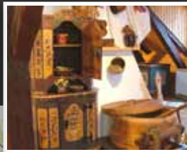
4. Muzeum a Pojizerská galerie