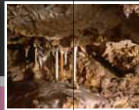
11. Bozkovské jeskyně